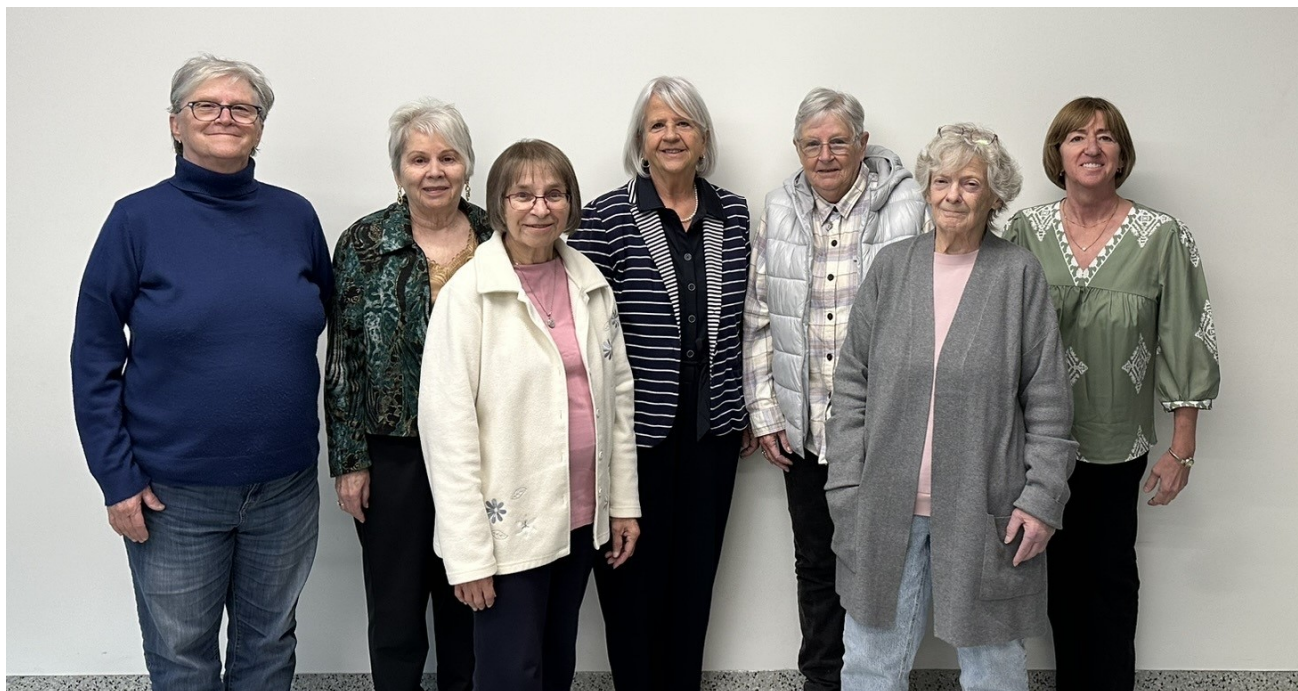
Le Conseil d'administration de l'AQDR en 2024-2025